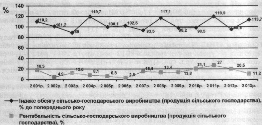
Рис. 1. Темпи зростання сільськогосподарського виробництва та динаміка рентабельності сільськогосподарського виробництва підприємств АПК України у 2001–2013 рр.