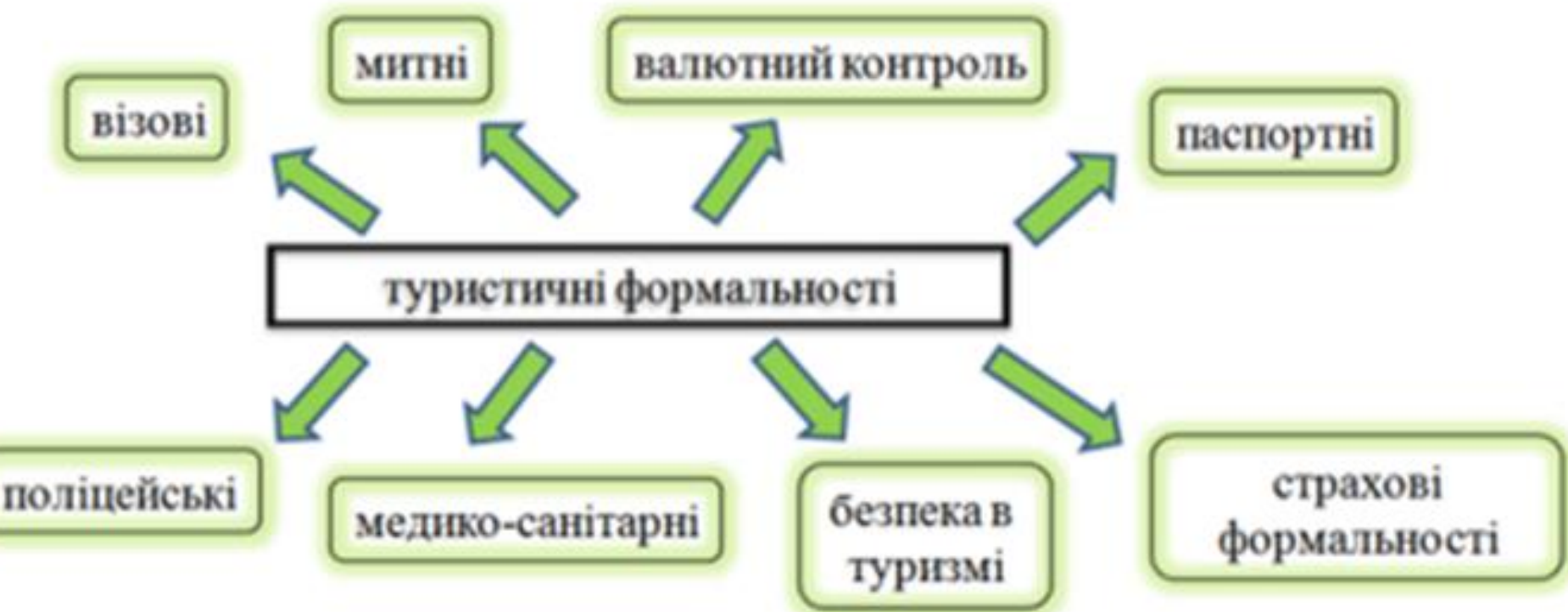
Рис. 1. Групи туристичних формальностей